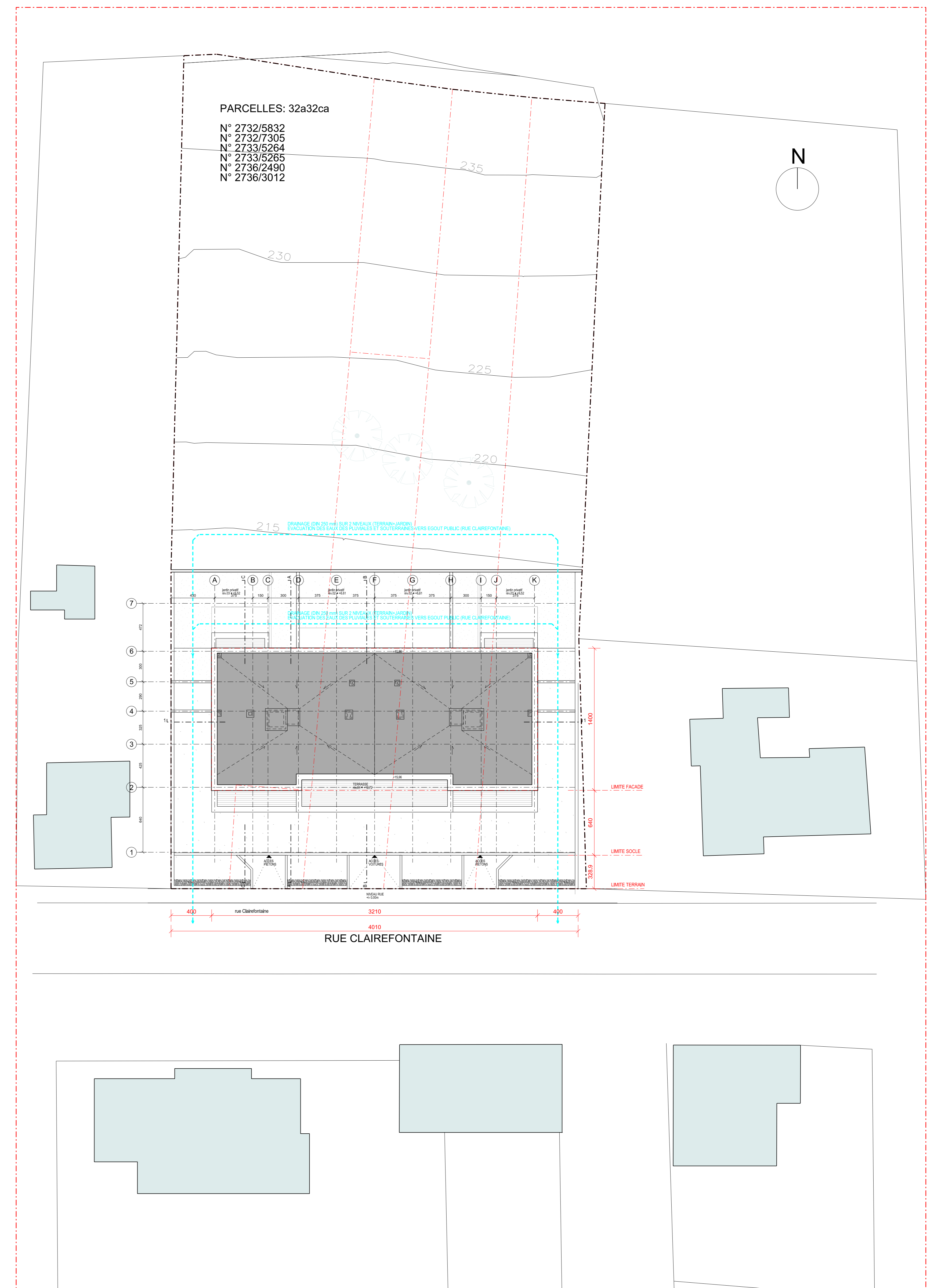
PLAN MASSE 1/200

Les mesures indiquées dans ce plan sont à vérifier sur place. Toute différence est à signaler de suite à la direction des travaux. Ce plan reste la propriété exclusive de notre bureau et ne peut être employé à usage autre que pour lequel il est confié à notre client ni communiqué à des tiers. Architecte: nichepetitarchitecte michel pett L. rue de ghorbe L-1524 Luxembourg T: 26 11 46 1 F: 26 11 46 26 E-mail: info@nichepetitarchitecte.com Maitre de l'ouvrage: Asmo Imagokux & Immo Participations s.a. 146, rue Muhlenweg L-2155 Luxembourg Projet: Construction d'une nouvelle résidence 133-135, rue Clairefontaine L-8221 Diekirch Document: plan rez-de-chaussée, plan toiture, plan situation Echelle: 1/100 - 1/200 Référence-Numéro: PTD_AUT_4.01_P00_PT_PM Statut: AUTORISATION Date: 24/10/2014